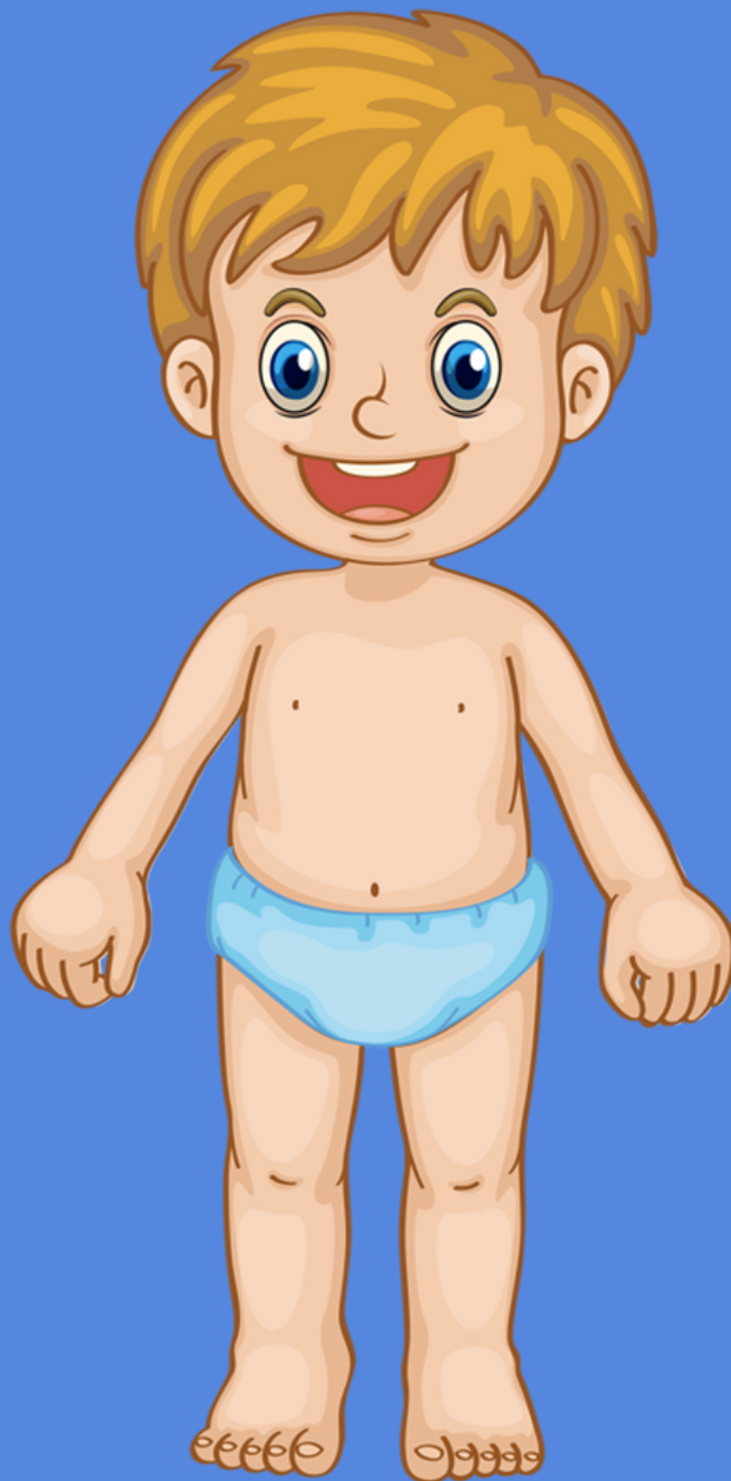
Figura 1. Cuerpo niño