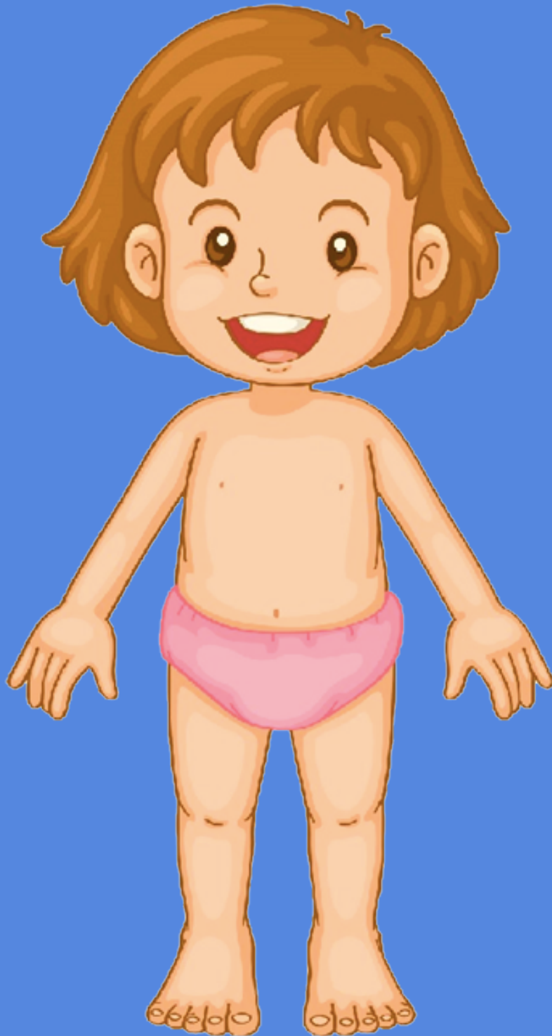
Figura 2. Cuerpo niña