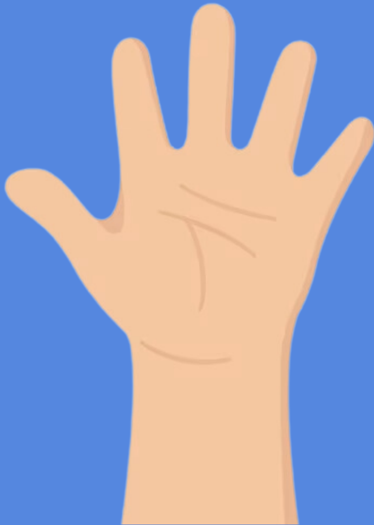
Figura 3. Mano